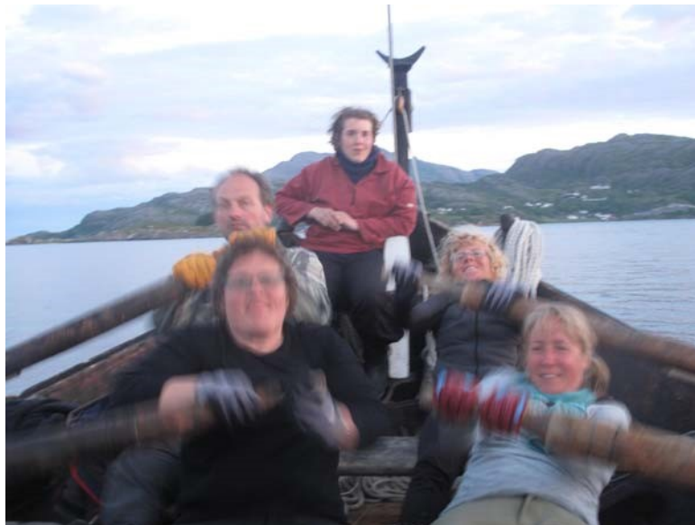
Natt-roing ved Dønna, Nordland.

Enkelte ganger er det å komme seg fram som står i fokus. Da er det om og gjøre å utnytte flest mulig timer med vind. Andre ganger fører vinden oss dit vi vil. Noen ganger blir det nattseilas, andre ganger må vi ro i noen timer for å komme til målet vårt. Noen ganger får vi fine kvelder med bål i fjæra, solrike og stille dager med bading fra båten. Andre dager er det mye vind, regn, kaldt og dårlig sikt. Det er umulig å forutsi hvordan en ukes tur med Braute blir, og det er noe av det beste med en slik tur.