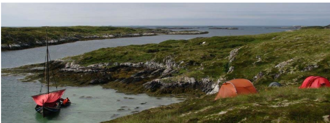
Braute i Gåsvær, Nordland.

Båtlaget Braute er medlem av studieorganisasjonen Studieforbundet Kultur og Tradisjon. Sommerturene og dugnadene er organisert som kurs, der det er en kursleder som har ansvar for at alle får opplæring.