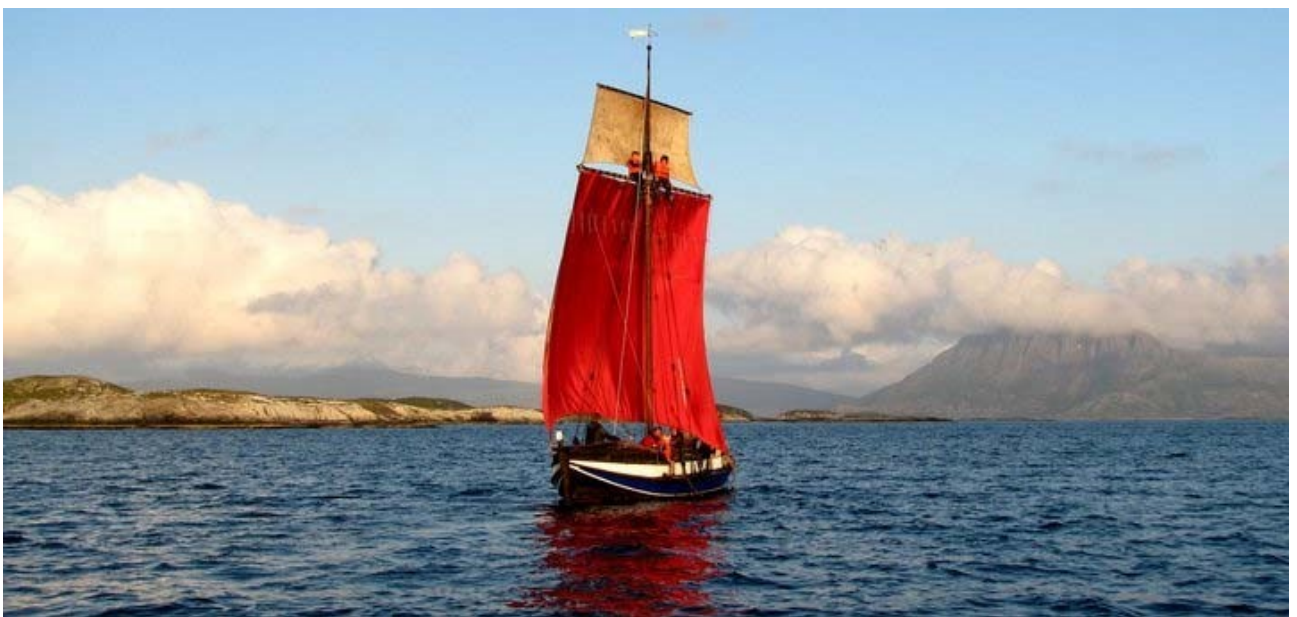
Braute tester ut silkesegl sommeren 2011.

Alle deltagere har medansvar for sikkerheten, og for at turen skal bli bra for alle.