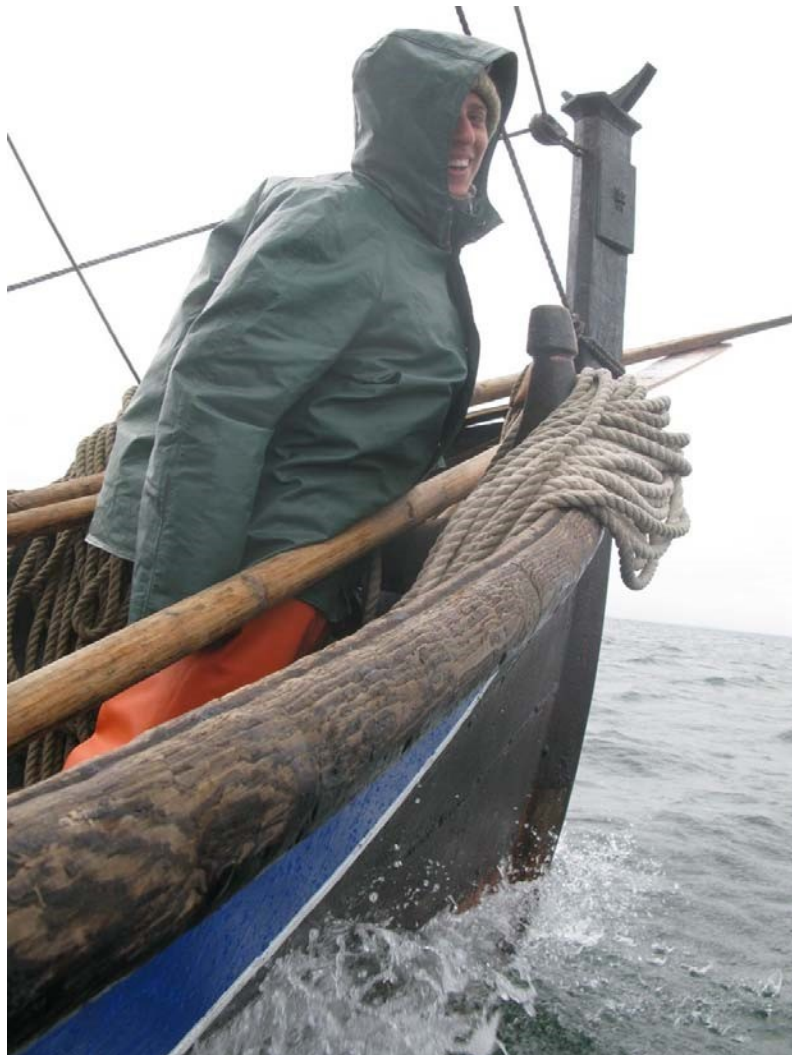
Gøy å stå i utkikken når det går unna!

Enkelte uker er det barn med, andre er det bare voksne. Det varierer hvor lange etappene er.